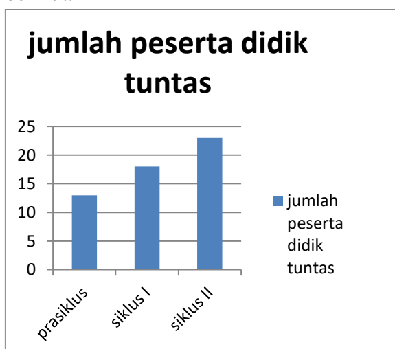
Gambar 1: Grafik Jumlah Siswa Tuntas

Untuk melihat peningkatan nilai hasil belajar siswa dapat dilihat pada grafik berikut.