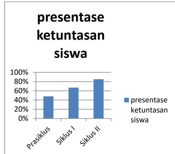
Gambar 2 : Grafik Persentase Siswa Tuntas

Kemudian pada siklus I meningkat menjadi 18 dari 27 siswa. Lalu pada siklus II kembali meningkat menjadi 23 dari 27 siswa tuntas KKM.