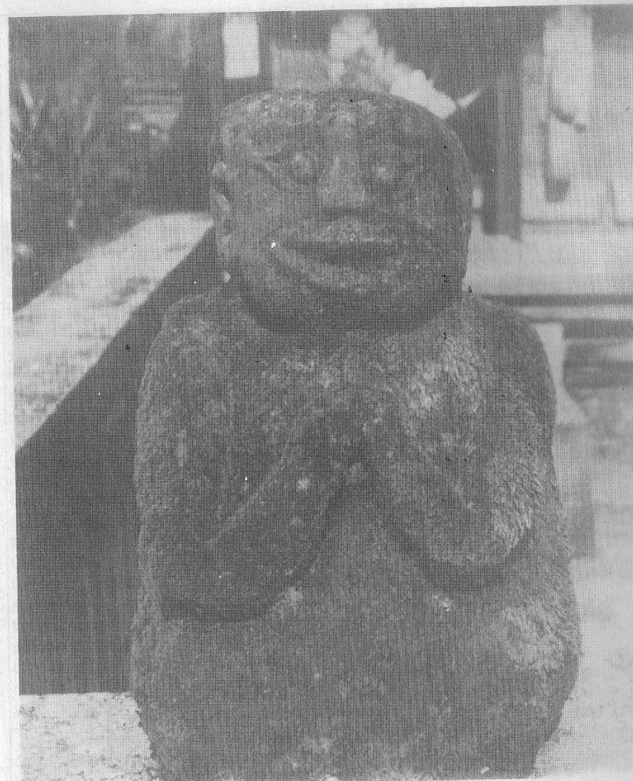
Foto 1. Arca Bercorak Megalitik, Merajan Pasek, Mengwi, Badung.

Purusa Mahaviranata. "Arca Sederhana Suatu Kajian Data Arkeologi, Pertemuan Ilmiah Arkeologi V ", Yogyakarta, hal. 434 - 445.