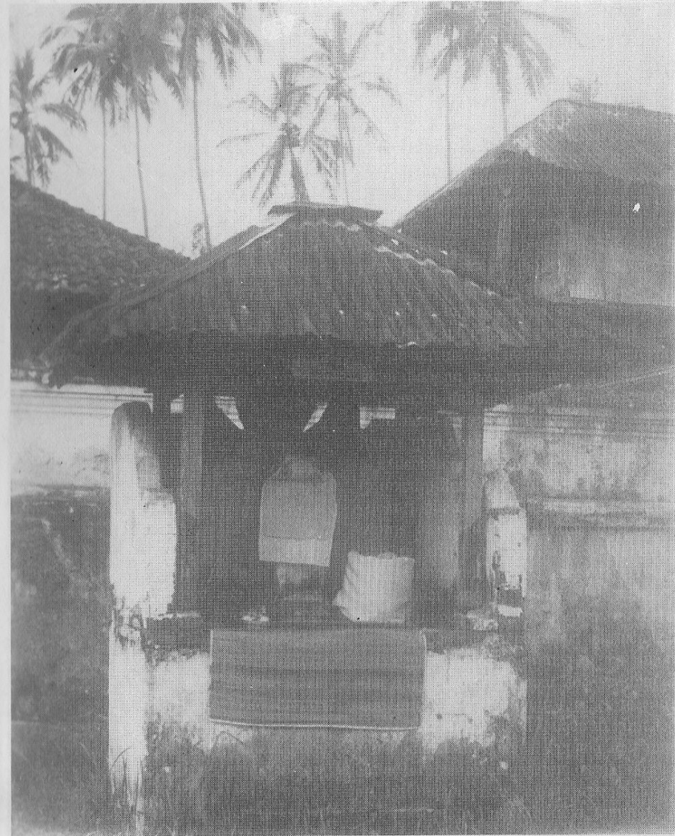
Foto 1. Pelinggih Dewa Gede Celak Kontong di Pura Desa/Bale Agung Desa Kayu Putih, Kecamatan Banjar Kabupaten Karangasem.