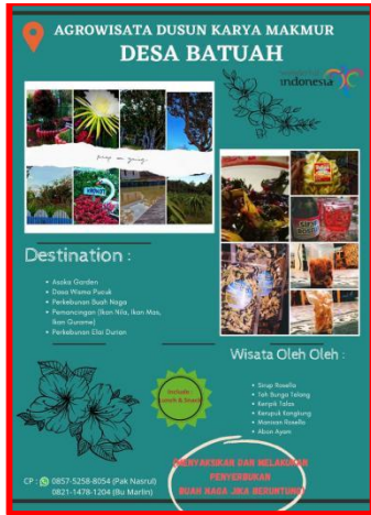
Gambar 6. Brosur Dusun Karya Makmur

Potensinya adalah perkebunan buah lai dan buah naga, kolam pemancingan ikan mas, nila dan gurame, Dasa wisma Pucuk dan Asoka Garden. Sedangkan hasil olahan dari kelompok dasa wisma Pucuk yang bisa menjadi buah tangan antara lain sirup Rosella, teh bunga telang, keripik talas, kerupuk kangkung, manisan rosella dan abon ayam