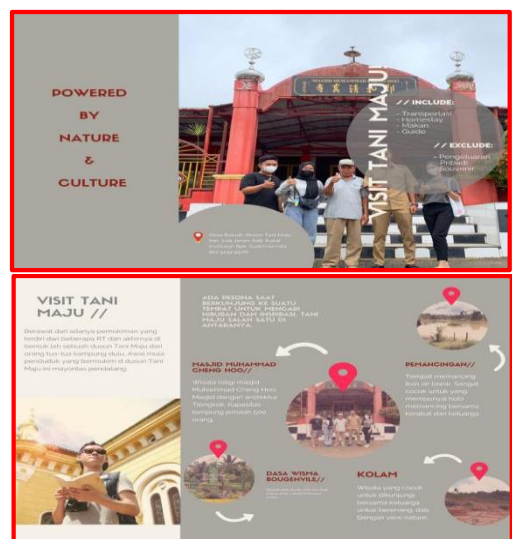
Gambar 5. Brosur Dusun Tani Maju

Potensi daya tarik yang ada antara lain Kolam, Pemancingan, Mesjid ChengHoo, Dasa Wisma Bougenville