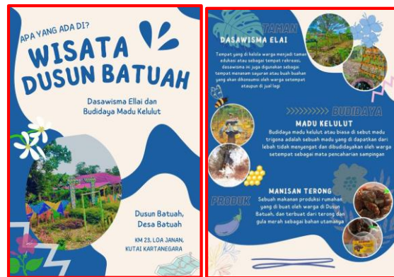
Gambar 9. Brosur Dusun Batuah

Potensi yang bisa diangkat dari dusun ini adalah Dasa Wisma Elai dengan hasil produk olahan andalannya adalah manisan terong dan daya tarik lainnya adalah budidaya madu kelulut.