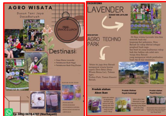
Gambar 8. Brosur Dusun Tani Jaya

Potensinya adalah perkebunan buah lai dan buah naga, sedangkan dasa wisma yang ada yakni dasa wisma lavender dengan hasil olahan pangan yang bisa jadi buah tangan antara lain, peyek bayam, peyek kemangi, lulur bedda lotong, beras kencur instan dan abon ikan.