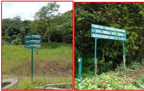
Gambar 2. Papan nama Tabuan Agro Techno Park

perusahaan yang masih aktif dan akses akan di buka pada 2 atau 3 tahun mendatang pada saat aktivitas tambang sudah berhenti.