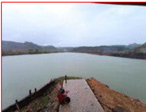
Gambar 1. Danau Ex Tambang di desa batuah

Danau ex tambang adalah lubang yang terbentuk karena pengeboman batu bara oleh Perusahaan batu bara di daerah Desa Batuah sehingga menjadi danau yang sangat menawan dengan warnanya jernih hijau kebiru-biruan membuat Danau Ex Tambang ini terlihat menarik dan layak dijadikan Wisata Tirta.