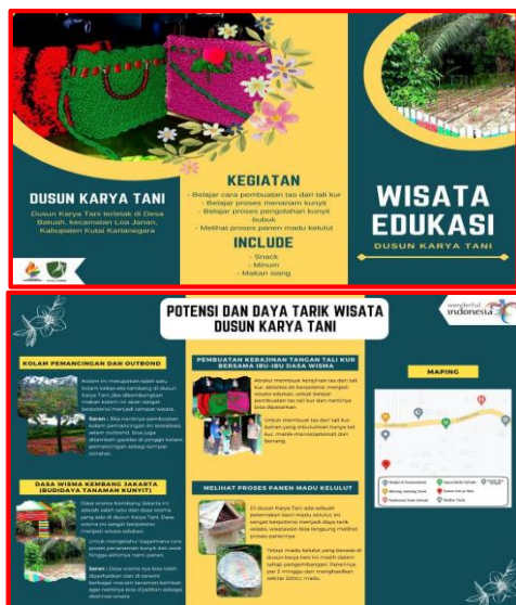
Gambar 11. Brosur Dusun Karya Tani

Potensi dan daya tarik wisata Dusun Karya Tani antara lain kolam pemancingan dan outbound . Sedangkan wisata edukasi yang bisa diangkat dari Dasa Wisma Kembang Jakarta sebagai wisata edukasi antara lain budidaya tanaman kunyit aktivitas yang bisa dilakukan yakni proses belajar menanam kunyit dan mengolah kunyit menjadi olahan pangan. Kemudian belajar membuat kerajinan tangan berupa tas dari tali kur. Selain itu kita juga bisa melihat proses panen madu kelulut.