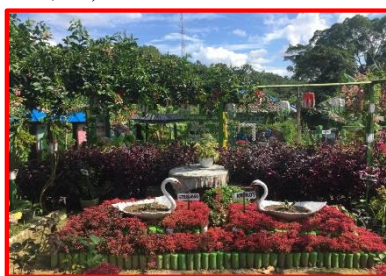
Gambar 3. Salah Satu Taman Dasawisma

Dasawisma adalah program PKK yang dibentuk untuk membangun kedekatan antara ibu-ibu rumah tangga dibagi ke dalam kelompok yang terdiri dari 10 KK, tugasnya adalah bercocok tanam, sambil berkebun sehingga hasilnya dapat dimanfaatkan untuk kebutuhan rumah tangga atau diproduksi menjadi sebuah produk yang bisa dijual sehingga menghasilkan pendapatan. Adapun tanaman yang ditanam di taman dasawisma ini adalah sayur-sayuran (bayam, sawi, kangkung, pare, terong, timun, dll) toga (tanaman obat keluarga seperti jahe, kunyit, kencur, serai, rosella, temulawak, dll) bumbu-bumbu (cabai, bawang prai, seledri, kemangi, tomat, lengkuas, dll)