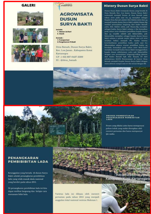
Gambar 12. Brosur Dusun Surya Bakti

Potensi yang bisa diangkat dari dusun ini adalah penangkaran pembibitan lada (sahang/merica)