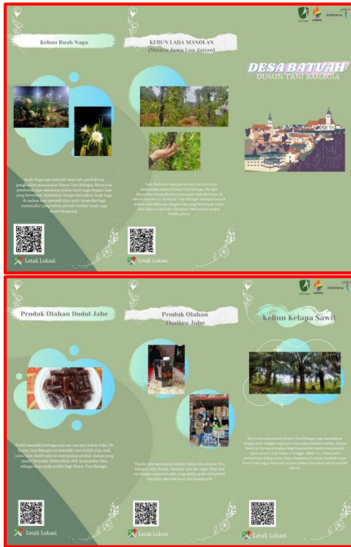
Gambar 10. Brosur Dusun Tani Bahagia