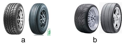
Gambar 3. Contoh Tread Pattern Ban Basah (A) Dan Ban Kering (B)