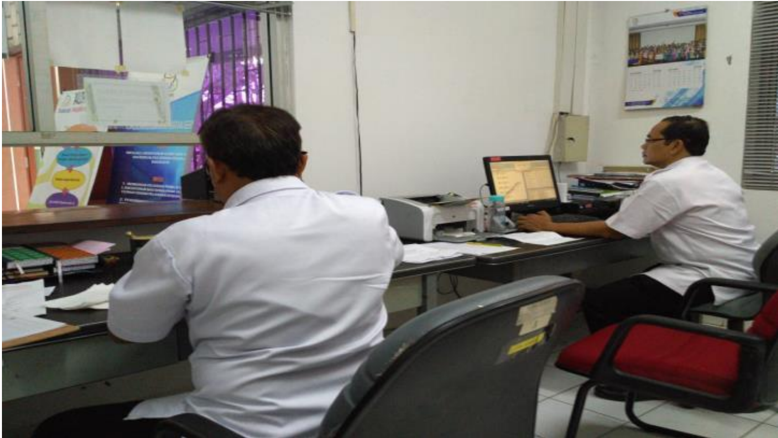
RUANG PENDAFTARAN (SEBELUM PANDEMI)