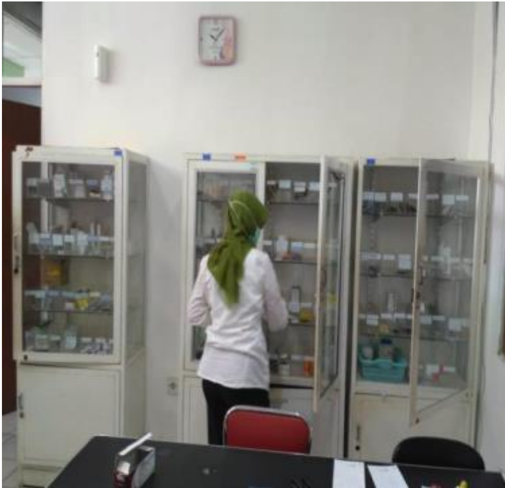
RUANG DEPO OBAT (SEBELUM PANDEMI)