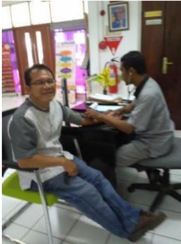
RUANG PEMERIKSAAN AWAL (SEBELUM PANDEMI)