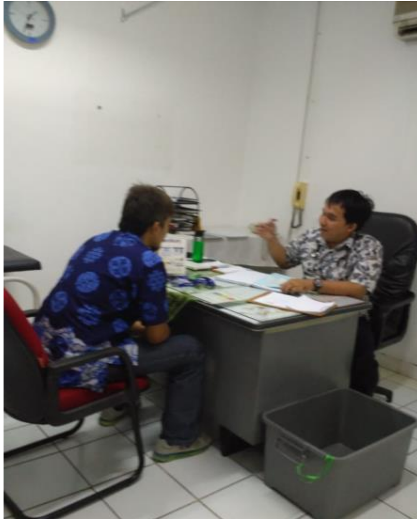
RUANG PERIKSA DOKTER UMUM (SEBELUM PANDEMI)