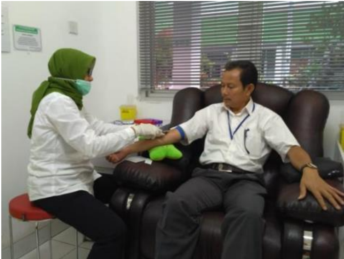
RUANG SAMPLING DARAH (SEBELUM PANDEMI)