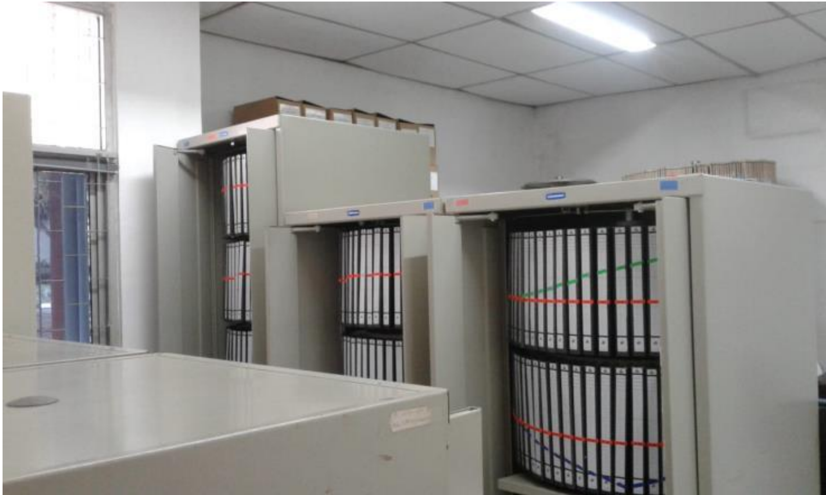
RUANG REKAM MEDIS