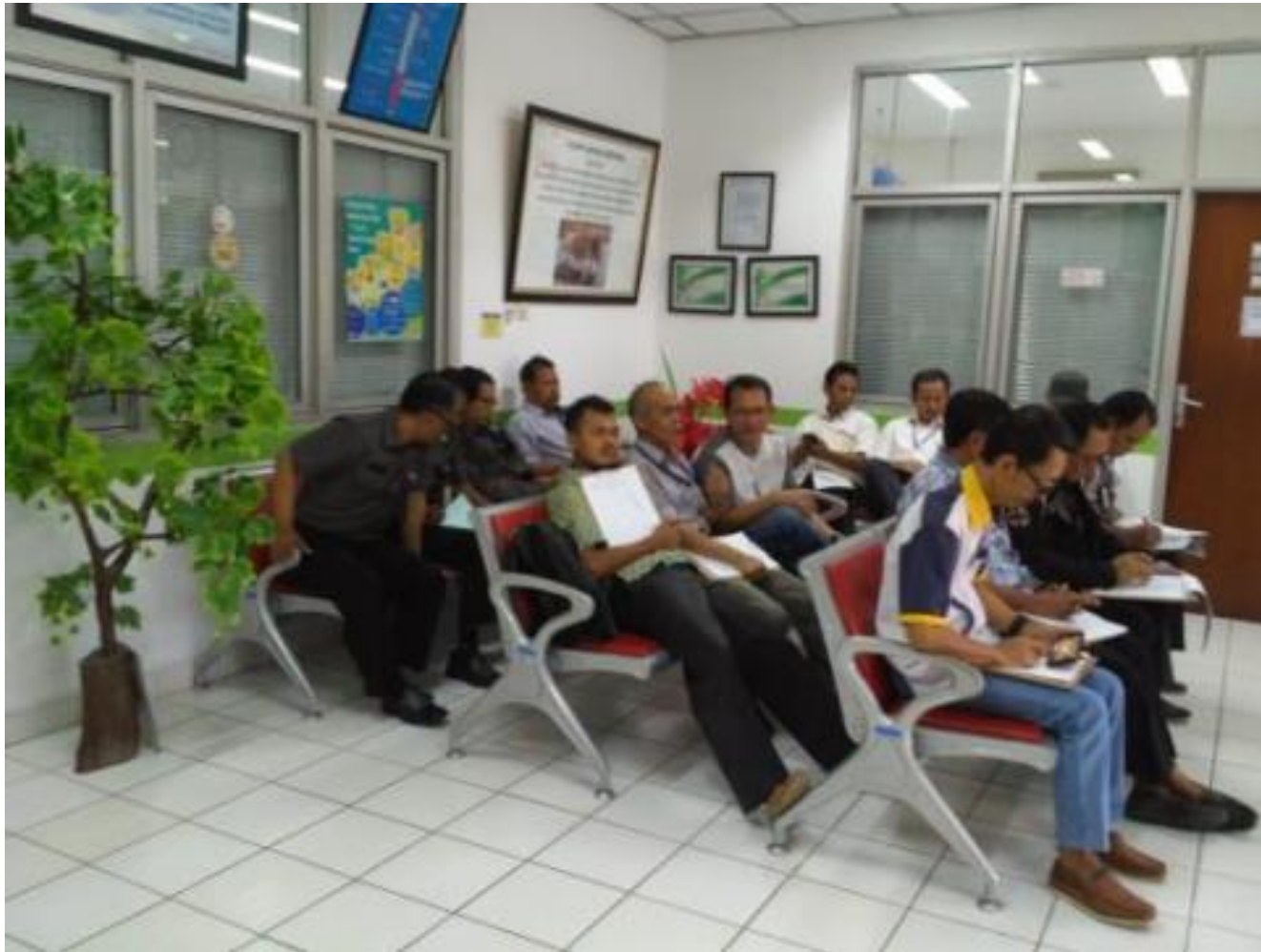
RUANG TUNGGU PASIEN (SEBELUM PANDEMI)