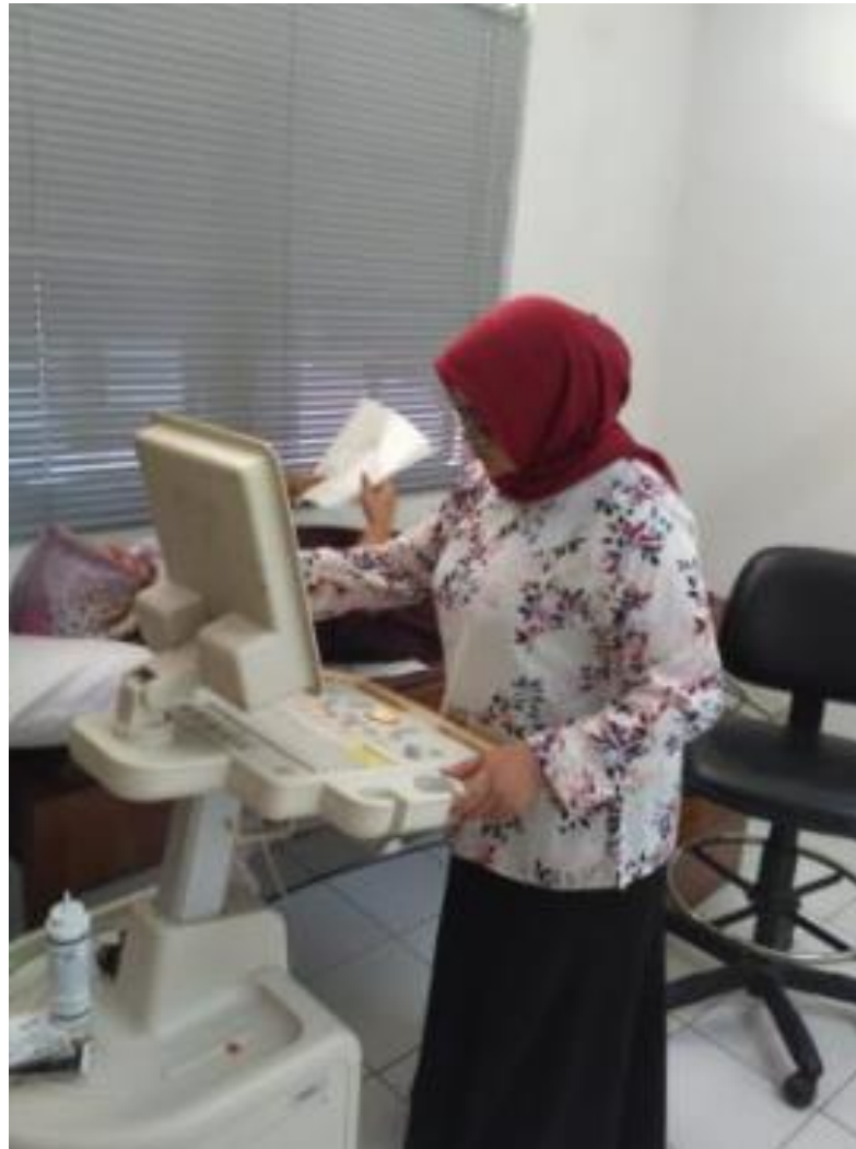
RUANG PERIKSA USG (SEBELUM PANDEMI)