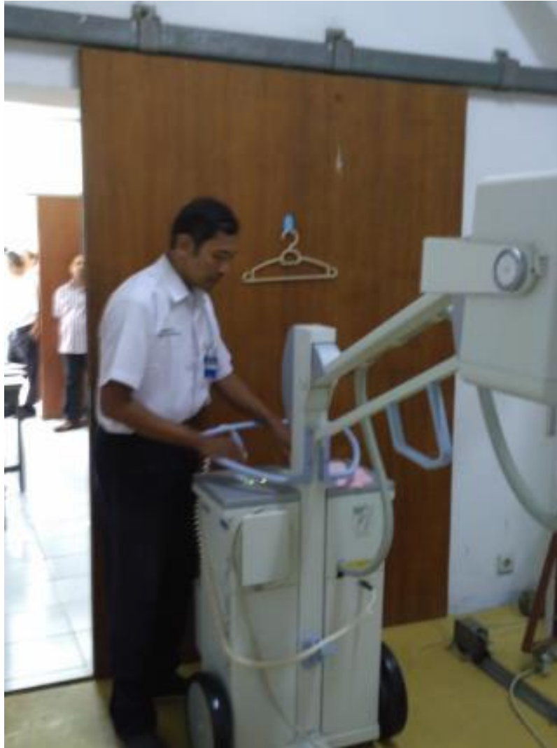
RUANG RADIOLOGI (SEBELUM PANDEMI)